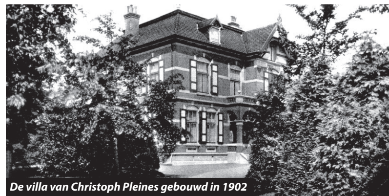
De villa van Christoph Pleines gebouwd in 1902