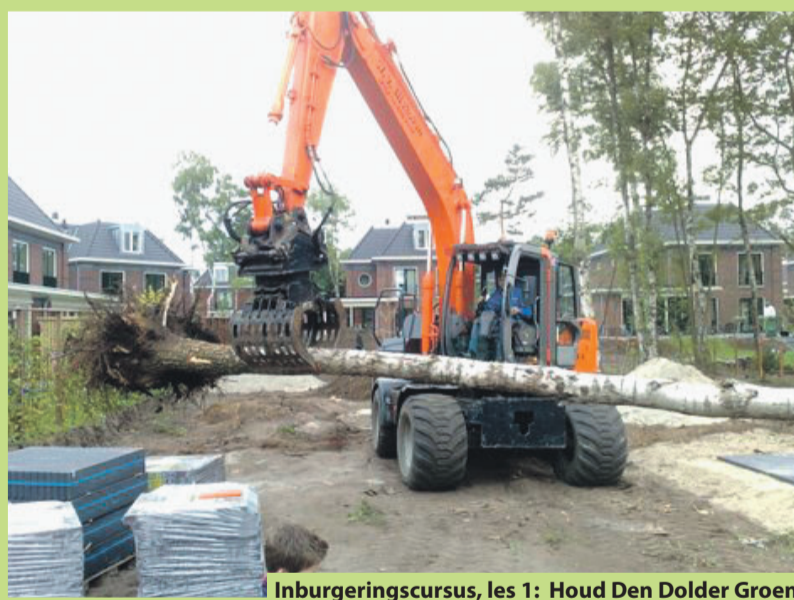
Inburgeringscursus, les 1: Houd Den Dolder Groen